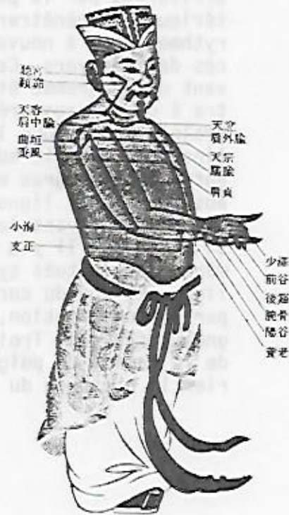
圖五十六——仿明版古圖(二)