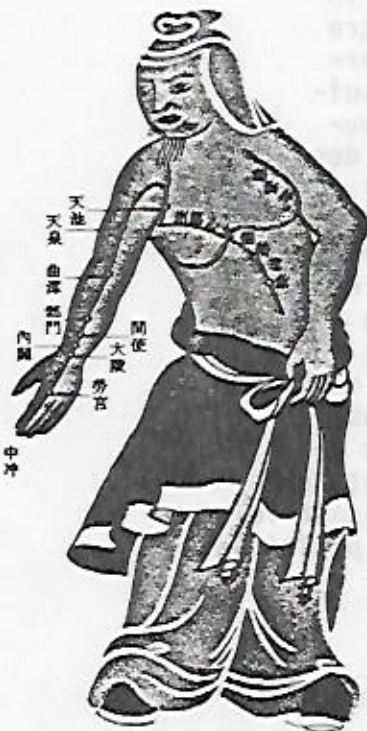
圖六十三——仿明版古圖(九)