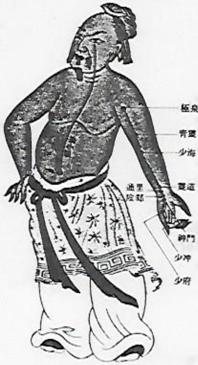
圖六十二——仿明版古圖(八)