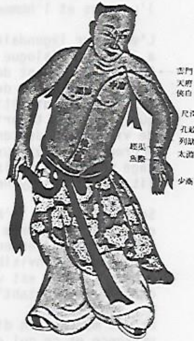
圖六十一——仿明版古圖(七)