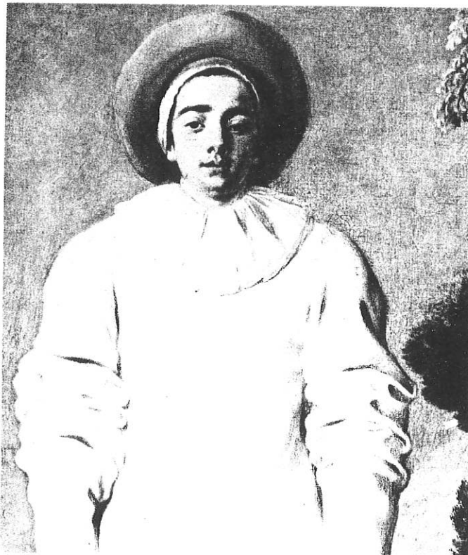
Le "Gilles" de Watteau