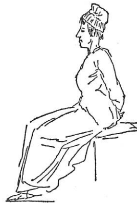
Marie-Antoinette, la "veuve Capet", sur la charrette du bourreau, le 16 octobre 1793.