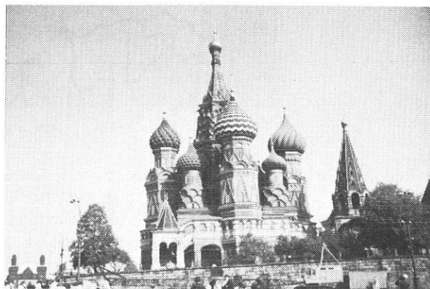
Basilique Le Bienheureux