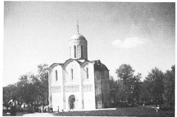
Cathédrale St-Dimitri à Vladimir