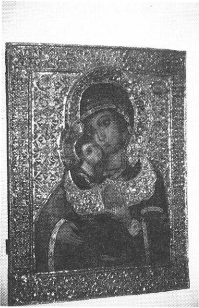
Icone de Souzdal