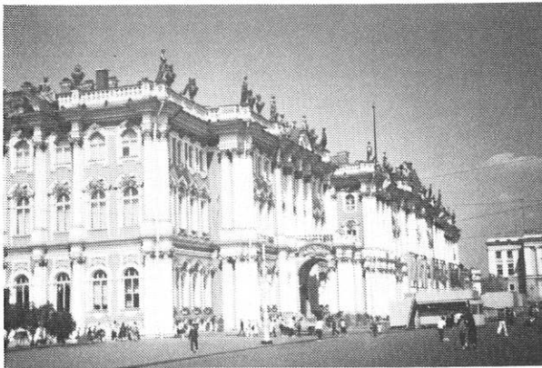
Musée de l'Ermitage à Léningrad