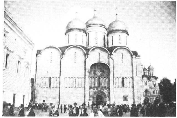
Cathédrale St-Michel du Kremlin